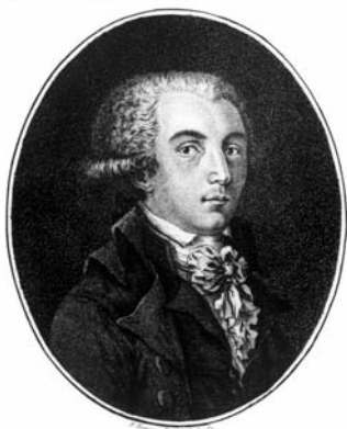
Marie - Joseph Chénier