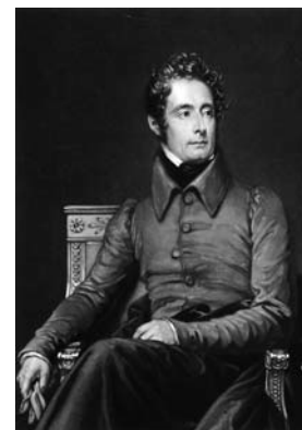
Alphonse de Lamartine

La République tu serviras, Une, indivisible seulement. Aux Fédéralistes feras La guerre éternellement. En bon Soldat, tu te rendras À ton service exactement. Tes père et mère honoreras, Et la vieillesse mêmement. Pour tous les cultes tu seras, Comme veut la Loi, tolérant. Les beaux-arts tu cultiveras ; D'un État ils sont l'ornement. À ta Section tu viendras, Convoquée légalement. Ta boutique tu fermeras, Chaque Décadi strictement. La Constitution tu suivras, Ainsi que tu en as fait serment. À ton poste tu périras, Si tu ne peux vivre librement.